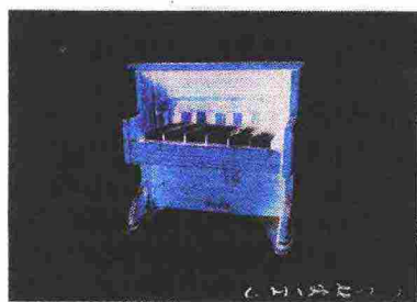
«I sei scalini sono la musica» (anni Novanta) di Giuseppe Chiari

poi a Sylvano Bussotti col quale nel 1962 organizza la manifestazione «Musica e Segno», presentata a Roma presso la Galleria Numero e a Buffalo negli Usa presso il Creative and Performing Art Center. È l'inizio delle composizioni musicali basate su segni e parole scritte, ma anche della sua partecipazione a Fluxus, invitato dal fondatore del movimento, Maciunas, e della sua presenza a New York nell'ambito dell'Avant Garde Festival. A Firenze, oltre a prendere parte negli anni Sessanta al Gruppo 70, la cui ricerca poi sfocerà nella Poesia visiva, Chiari si impegna attivamente in Zona non profit art space, lo spazio ideato nel 1974 insieme a Nannucci, Masi, Mariotti, Moretti, Pettena, portando in città, per oltre un decennio, i più significativi nomi della scena internazionale. □ Laura Lombardi